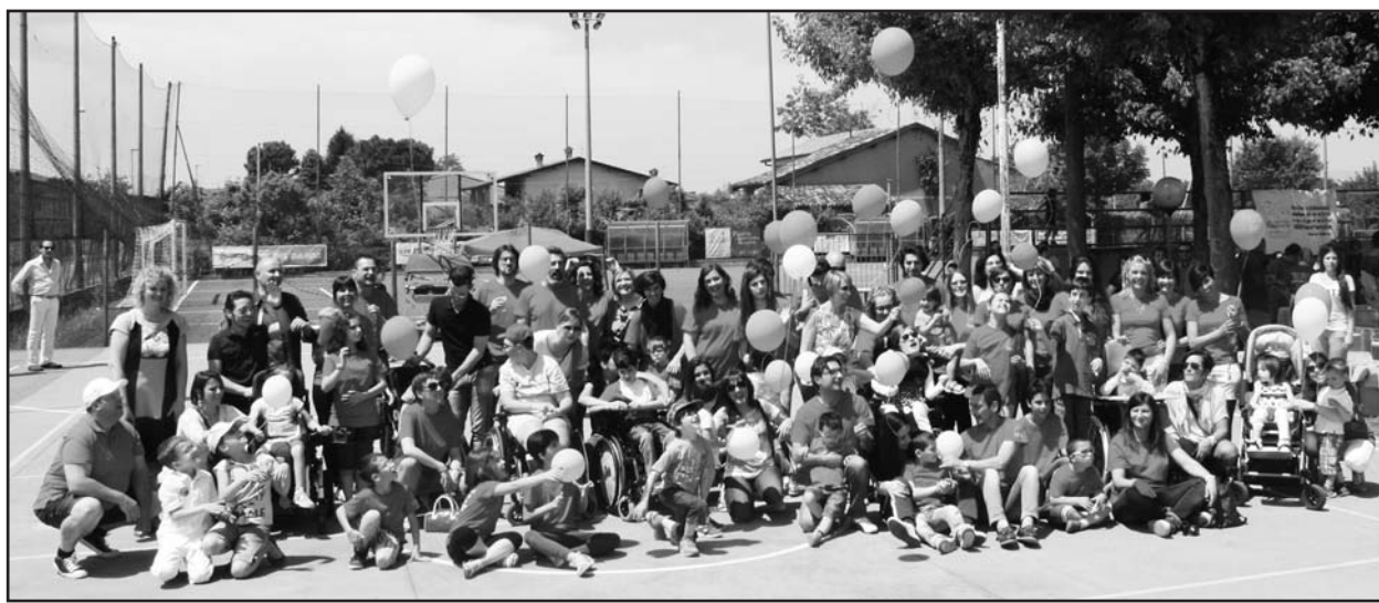
Il lancio dei palloncini da parte dei ragazzi e dei loro genitori.