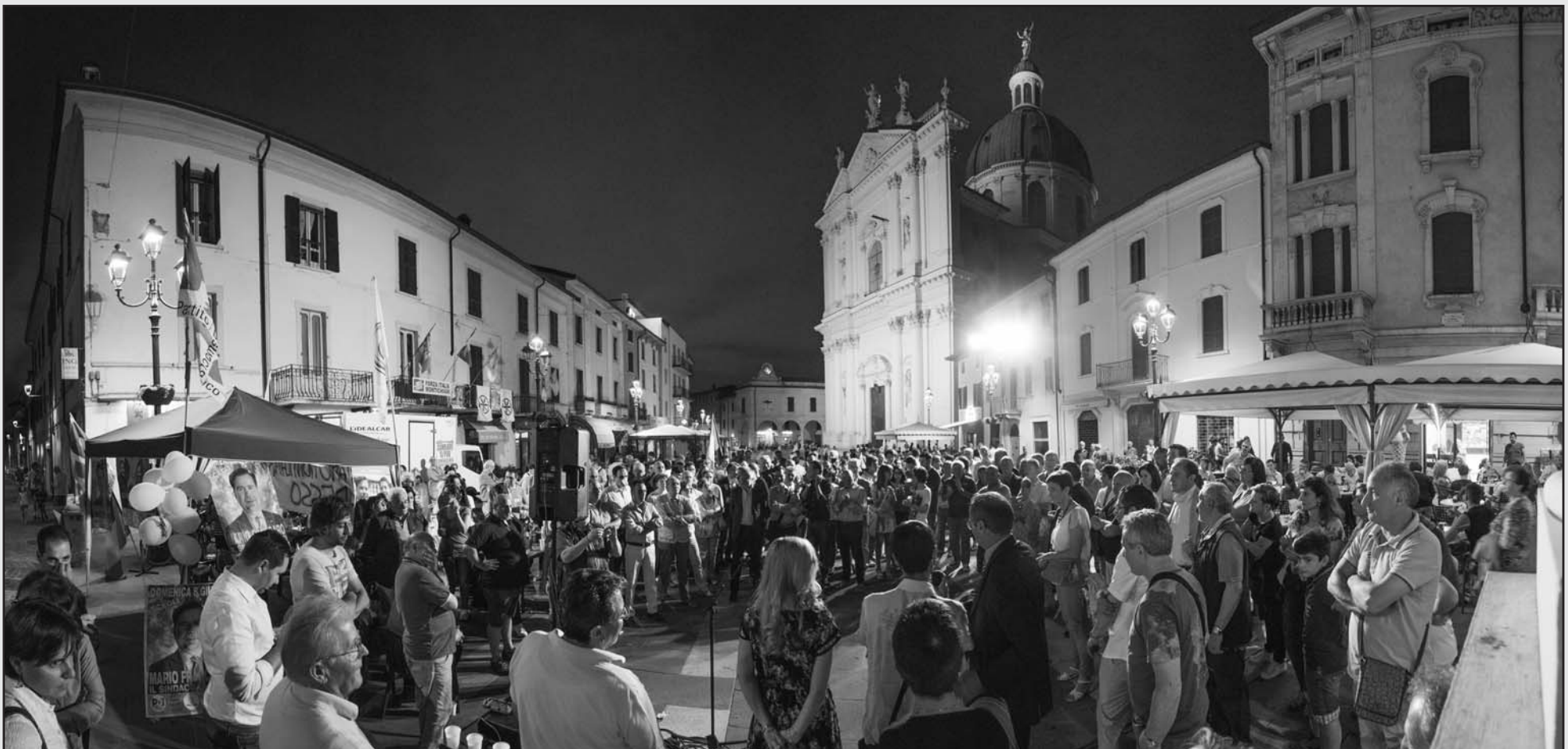
Una campagna elettorale fra la gente.