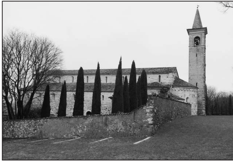
La Pieve di San Pancrazio.

Altrettanto affascinanti i due eventi che si verificano negli equinozi di primavera ed autunno: se c'è sereno il raggio del sole calante penetra