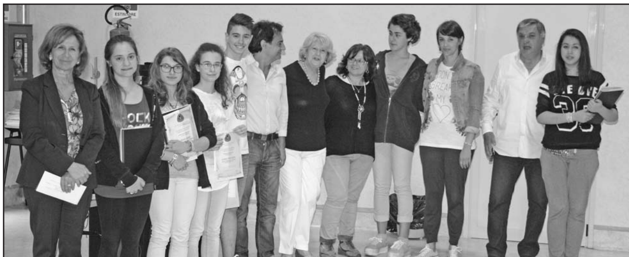
I vincitori del 12° Concorso Aido "Cristian Tonoli".