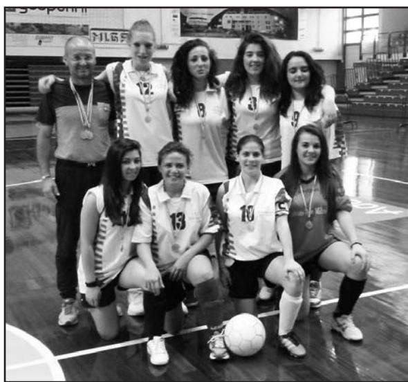
La squadra vincente.